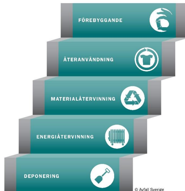
Figur 2 EU:s avfallshierarki, nu även i 15 kap 10 § miljöbalken.

Kommunens strategi för att nå visionen, se kapitel 2.2, är att utifrån de prioriteringar som anges i EU:s avfallshierarki , genomföra åtgärder i samarbete med olika organisationer och med kommunikation , miljöstyrande avfallstaxa , tillsyn , rutiner för upphandling och fysisk planering som verktyg. Genom att arbeta med en miljösäker drift av avfallsanläggningar , underlätta för hushåll och verksamheter att sortera och lämna sitt avfall på ett miljöriktigt sätt ("Det ska vara lätt att göra rätt") och att föregå med gott exempel avseende avfallshanteringen i egna verksamheter kan kommunerna förbättra förutsättningarna för att målen ska kunna nås.