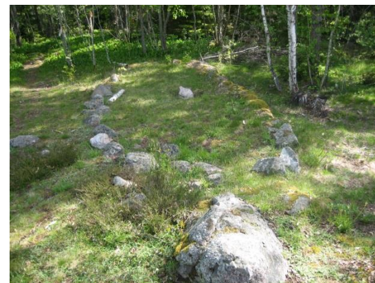
Skeppssättning i Fyrby