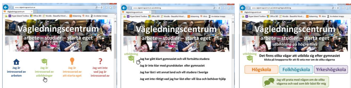
Bild: Exempel på hemsidan startsida och steg 2 & 3

Idag erbjuds information på olika ställen hos de olika aktörerna och individen måste leta på flera olika ställen för att få tillgång till all information. Vägledningscentrums hemsida blir en väg in till de olika aktörerna, den utgår från individens behov av information och genom sin struktur guidar den individen till rätt källor hos de olika aktörerna. Precis som en studie- och yrkesvägledare ställer hemsidan frågor om individens mål, utbildningsbakgrund och arbetslivserfarenhet, svaren på frågorna lotsar individen vidare på hemsidan och sedan genom länkar vidare till rätt plats på aktörernas respektive hemsidor. Hemsidans struktur innebär att individen inte behöver leta på flera olika platser efter information utan endas svar på ett par enkla frågor för att sedan guidas till rätt plats.