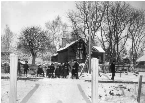
Västermarken.