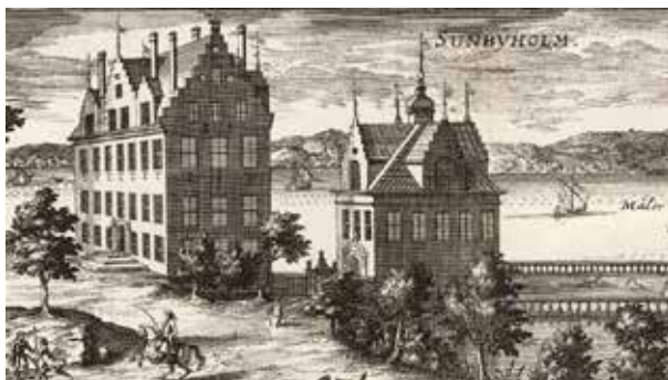
Sundbyholms slott ur Erik Dahlbergs Suecia Antiqua et Hodierna

15.00-15.30 årsmöte för Eskilskällans Vänner.