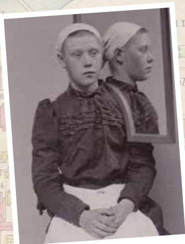
En kropp och en själ att straffa 23/4.