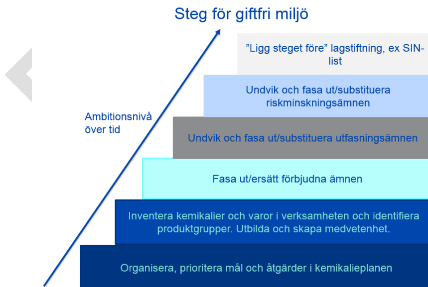
Bild 1. Trappa som visar vilka steg som behöver tas i kemikaliearbetet och ambitionsnivån över tiden 2019-2030.