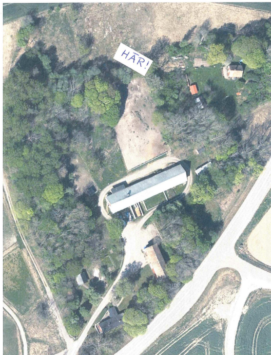
Eskilstuna kommun, © Lantmäteriet 2017

Det är angeläget att beståndet av blandade lövträd med ädellövträd bevaras, men ett bostadshus i nytt läge kan i framtiden innebära önskemål att träd tas bort. Därför ställs bevarande av trädbeståndet som ett villkor för dispensen. Träd som dör eller på annat sätt kan utgöra en risk, ska dock kunna tas bort, och träd som står mycket tätt, ska kunna gallras utan hinder.