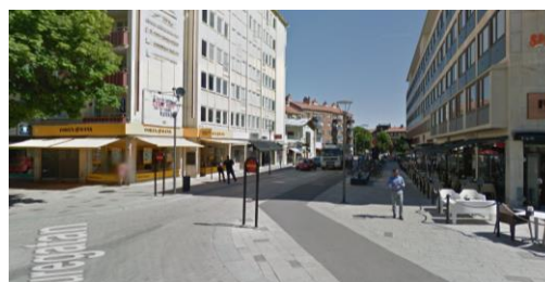
Smedjegatan Västerås