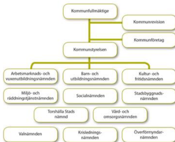
Figur 1 Nämnder i Eskilstuna kommun 2016

Respektive nämnds och förvaltnings ansvar regleras i reglementen antagna av kommunfullmäktige den 10 december 2015.