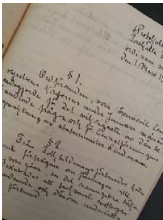
Handskrivet protokoll från 1911.

Tidningsmaterial ger också en god uppfattning om rösträttskampen och speglar stämningar och attityder från tiden fram till den allmänna rösträtts införande. Lokaltidningar som Eskilstuna-Kuriren (liberal), Tidningen Folket (socialdemokratisk) och Sörmlandsposten (konservativ) finns på mikrofilm hos Eskilstuna stadsbibliotek liksom i form av tidningslägg hos Arkiv Sörmland.