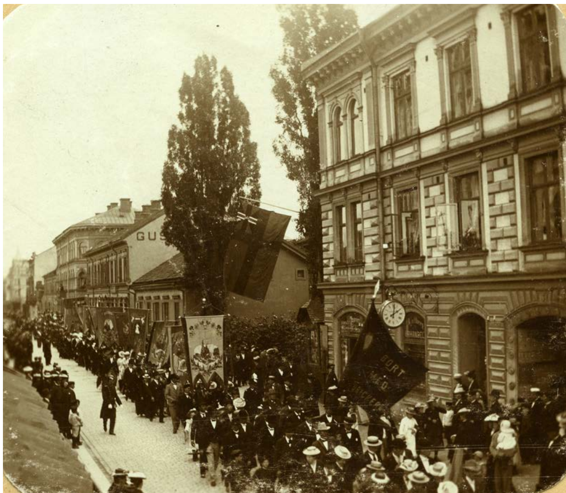
Demonstration i Eskilstuna vid seklets början.

Demokrati handlar om alla människors lika värde och rättigheter och om möjligheten att vara med och bestämma. 1919 klubbade riksdagen igenom allmän och lika rösträtt för män och kvinnor. Det innebar slutet på en lång kamp för demokratiska rättigheter och inledningen på en lång period av reformer och framsteg.