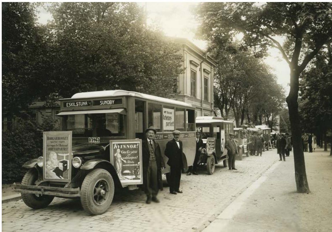
"Gå och rösta" är budskapet i valpropagandan från socialdemokraterna 1928.

När Sveriges riksdag i maj 1919 fattade beslut om allmän och lika rösträtt för män och kvinnor var det en viktig milstolpe för den svenska demokratin. Beslutet innebar att en stor andel av landets vuxna befolkning nu hade fått rätt att rösta, för första gången i historien också de svenska kvinnorna.