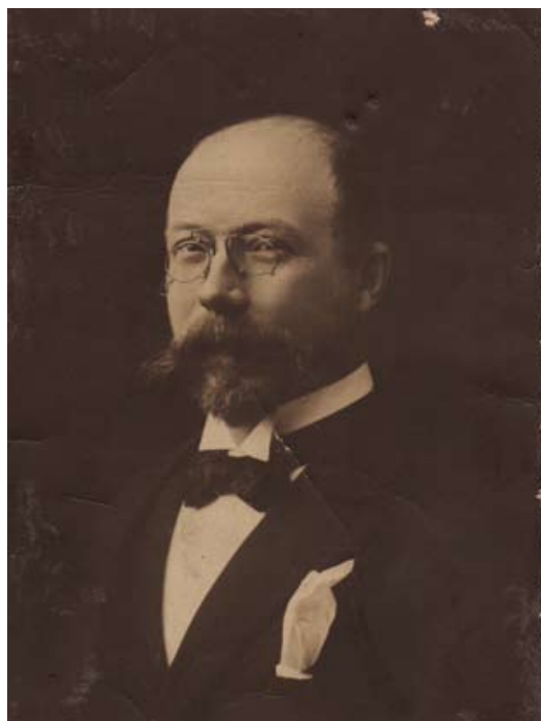
Carl Larsson återkom till sommaridyllen även som firad konstnär.

R edan som femtonåring tog han för egna pengar båten från Stockholm till Eskilstuna, och därifrån till fots den sista biten ut till Västergården. Han kom senare att köpa en egen liten stuga alldeles intill, som han ända fram till ett par år före sin bortgång år 1919 årligen besökte. Denna döptes till Minsta, men kallas än idag mest för "Carl Larsson-stugan".