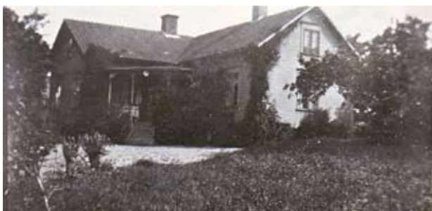
Det idylliska Lilla Lövhulta var Carl Larssons hemvist i flera omgångar.

Nere i Företagsarkivets depå ligger bland många andra handlingar i Lilla Lövhulta gårdsarkiv ett par bleknade fotografier, några vykort och en del brev från tiden kring förra sekelskiftet. Bakom dessa dokument står en av Sveriges mest kända konstnärer, välkänd i Sverige likväl som utomlands, nu liksom då det begav sig.