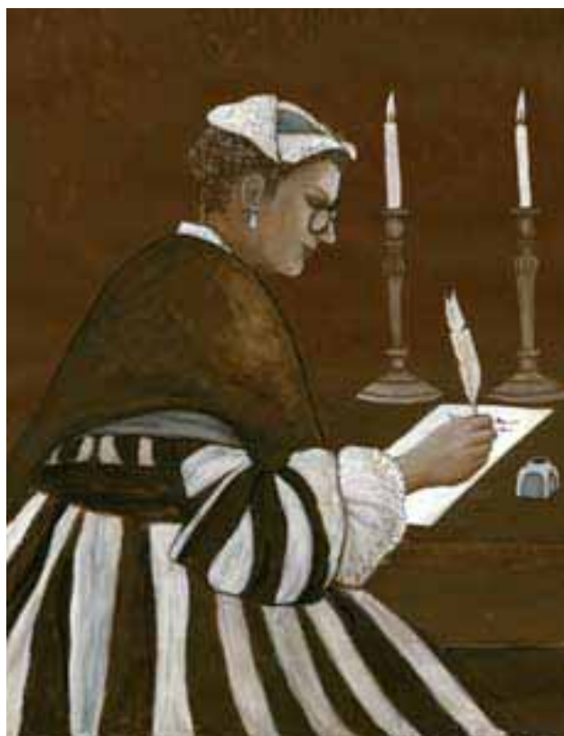
I brev efter brev bad den allt fattigare grevinnan att hon skulle få sina pengar