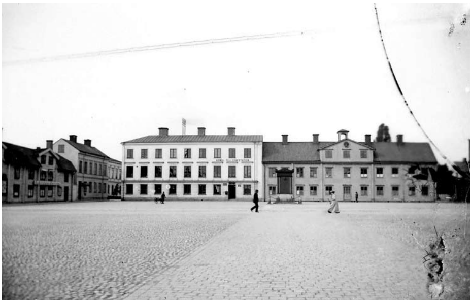
Nuvarande Fristadstorget kallades på 1890-talet för Rinmans torg. Här syns Rinmansmonumentet framför skolan vid den sida av torget där stadshuset senare (1897) uppfördes.

där arbetsskygga, försupna smeder höll till men även de yrkesstolta smeder som slagits ut av den ökande mekaniseringen i fabriker. När sedan Gap-Sundin uppträder i lokalen är identifikationen av orten fullständig. Vad personkaraktäristiken anbelangar är även den vag: en ”ljuslagd man av medellängd”, mannen hade en ”reslig och välbyggd gestalt” etc. Dock torde stadens borgmästare, i boken kallad Ek, genast ha avslöjats som verklighetens Sixten Alm.