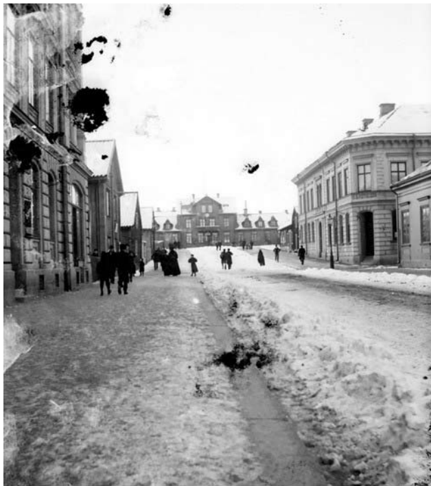
Drottningsgatan på 1890-talet. Här och i närheten rörde sig Stockholmsdetektiven i den klassiska brottmålsromanen.