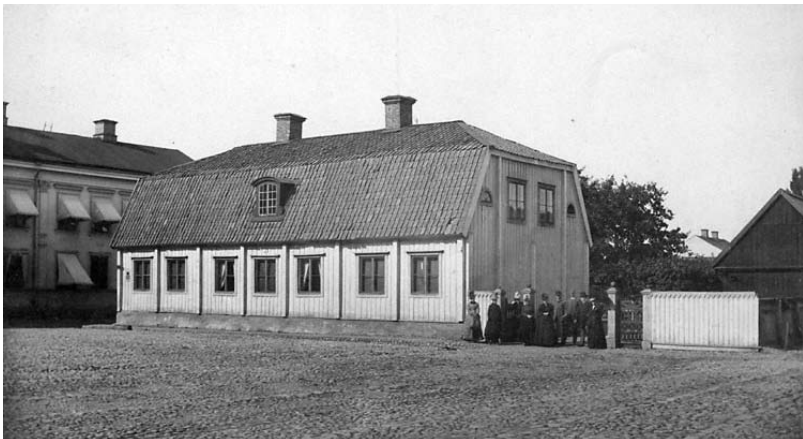
Borgmästargården i Eskilstuna år 1890.