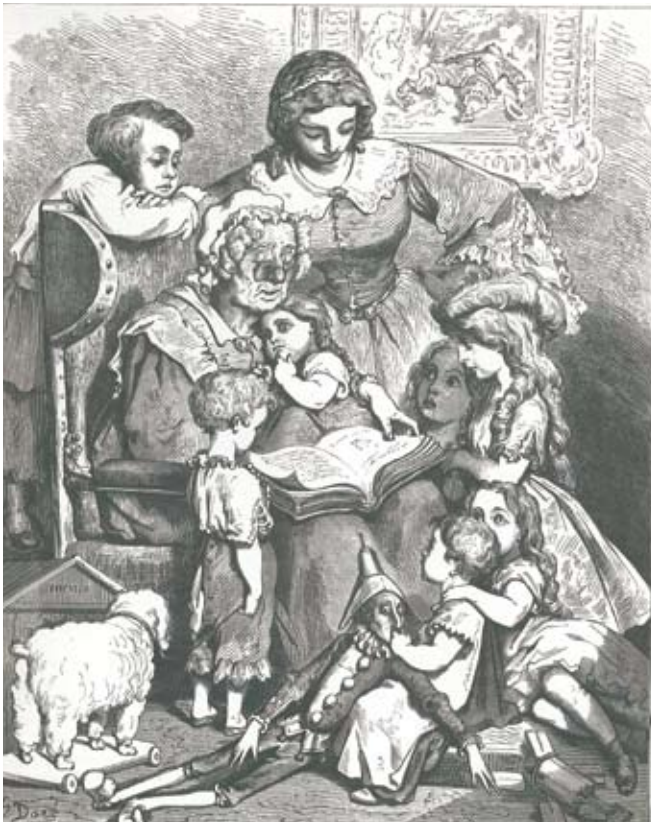
Ur "Gåsmors sagor", bild av Gustave Doré

Med 1700-talets vaknande intresse för barn och pedagogik insåg man att barnen måste formas av goda förebilder och att sagor och berättelser var av värde i sammanhanget. Sagosamlingar publicerades, som t ex ”Gåsmors sagor” som kom ut i Frankrike redan 1697. Under romantiken kom en annan livssyn och intresset för folksagor, sägner och sänger blev mycket stort. 1812 gav Bröderna Grimm för första gången ut ”Kinder-und Hausmärchen”, som utkommit i många upplagor och lästs av så många! Även i Norden verkade sagosamlare, i Norge hade vi Asbjørnsen & Moe, i Danmark Grundtvig och här i Sverige Hyltén-Cavallius & Stephens, bland andra.