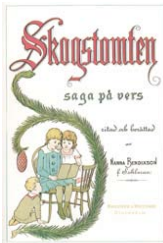
Skogstomten av Nanna Bendixson

Zweigbergk: Barnboken i Sverige 1750-1950