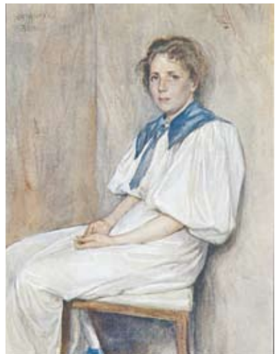
En ung Elsa Beskow, avporträtterad av maken Natanael Beskow

Hon föddes 1874, fadern dog tidigt och hon växte upp med sina syskon i en stor, intellektuell familj med dålig ekonomi men konstnärliga intressen. 1890 fick Elsa ett stipendium till Tekniska skolan (konstfack) där hon utbildade sig till teckningslärare. 1897 kom hennes debutbok, ”Sagan om den lilla, lilla gumman”. Berättelsen är fortfarande en mycket fin saga för små barn, med nyskapande bilder i den stil som kom att bli hennes egen. Ingen kunde illustrera svensk natur i närbild som Elsa Beskow. ”Hon målar ärligt och kärleksfull lite mosa och några linneor, och plötsligt har man hela skogen omkring sig med dunkel och väldighet och man kan gå in i den hur långt som helst” skriver Tove Jansson i Bonniers Litterära Magasin 1959.