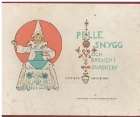
Pelle Snygg och barnen i Snaskeby av Otilia Adelborg

En annan av alla de författare som haft betydelse är docenten vid Åbo Akademi Adolph Ivar Arwidsson som åren 1834-42 gav ut samlingen ”Svenska fornsånger”. Del 3 förtecknade speciellt barnrim, visor och rimlekar, som sedan legat till grund för bl a många av Alice Tegnér’s visor och rim-och ramsböcker utgivna vid 1800-talets slut.