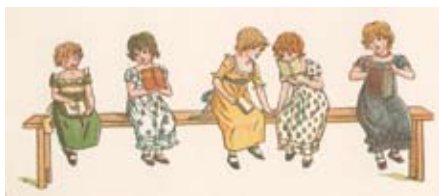
Bild ur Marigold garden av Kate Greenway