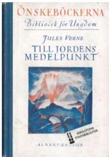
Till jordens medelpunkt av Jules Verne

ton i England skrev en lång serie om busfröet Bill som översattes och blev mycket populär.