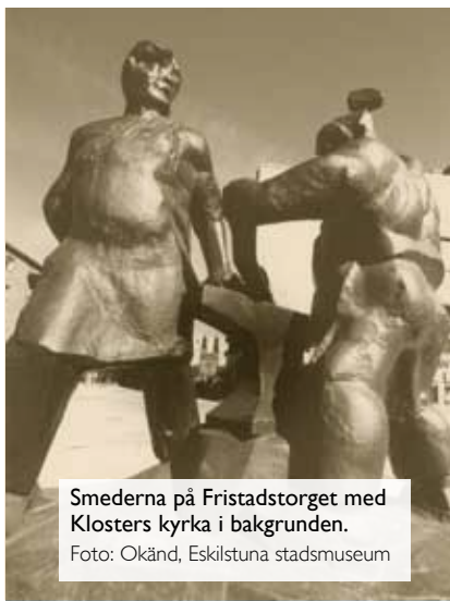
Smederna på Fristadstorget med Klosters kyrka i bakgrunden.