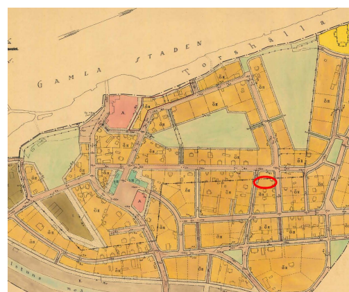
Utsnitt ur gällande detaljplan.