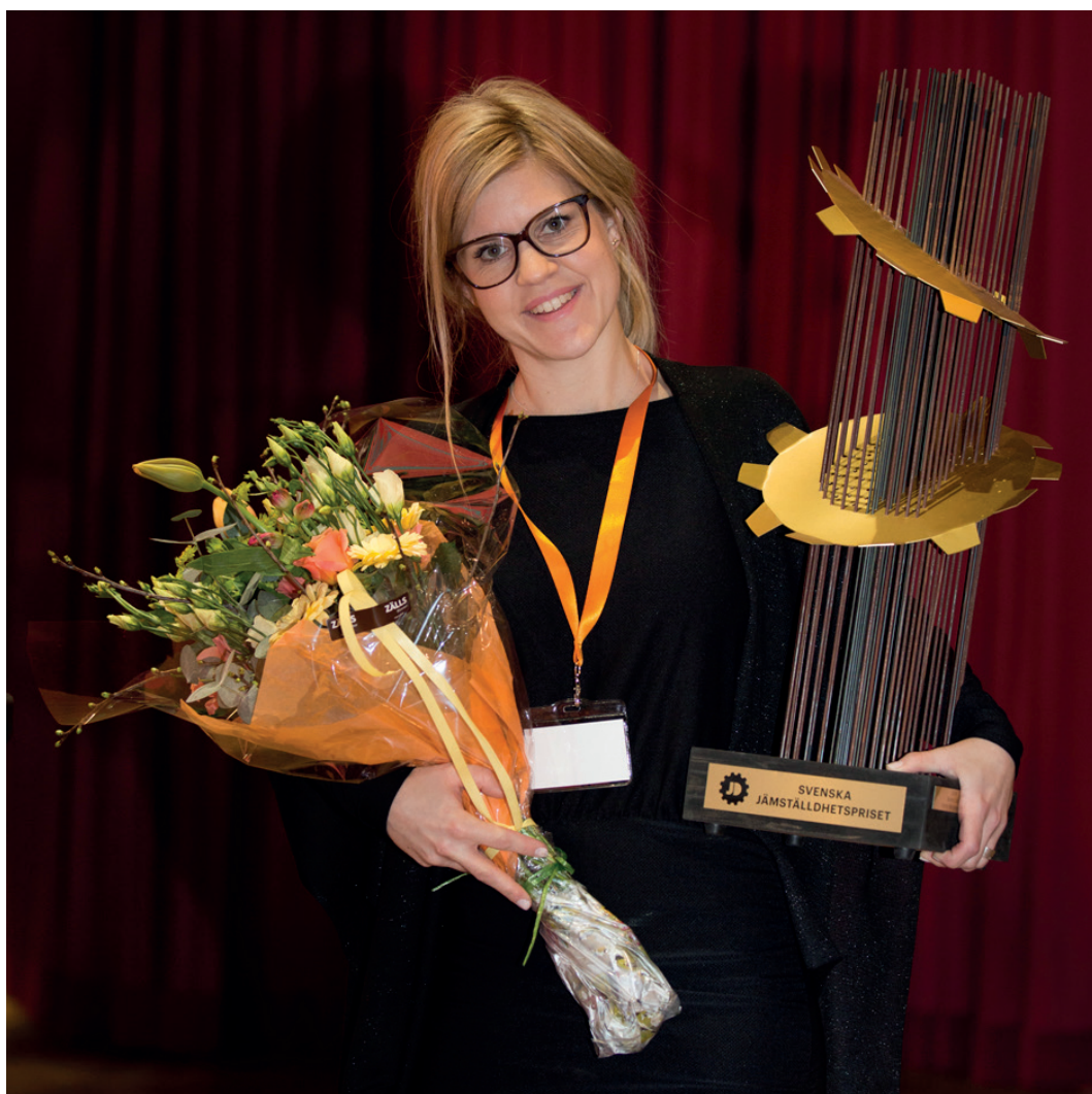
2017 vann Eskilstuna kommun Svenska Jämställdhetspriset. Vi jobbar vidare för att fortsätta vara Sveriges mest jämställda kommun.

I planen får du också kortfattad information om viktiga lagar och dokument inom jämställdhet.