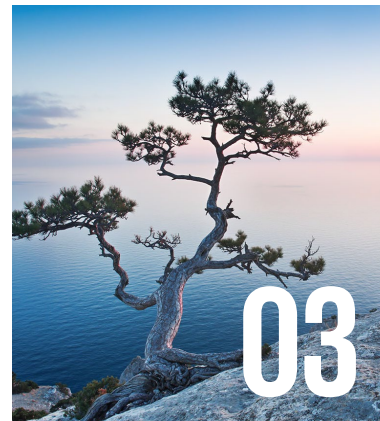
Resultat av granskning