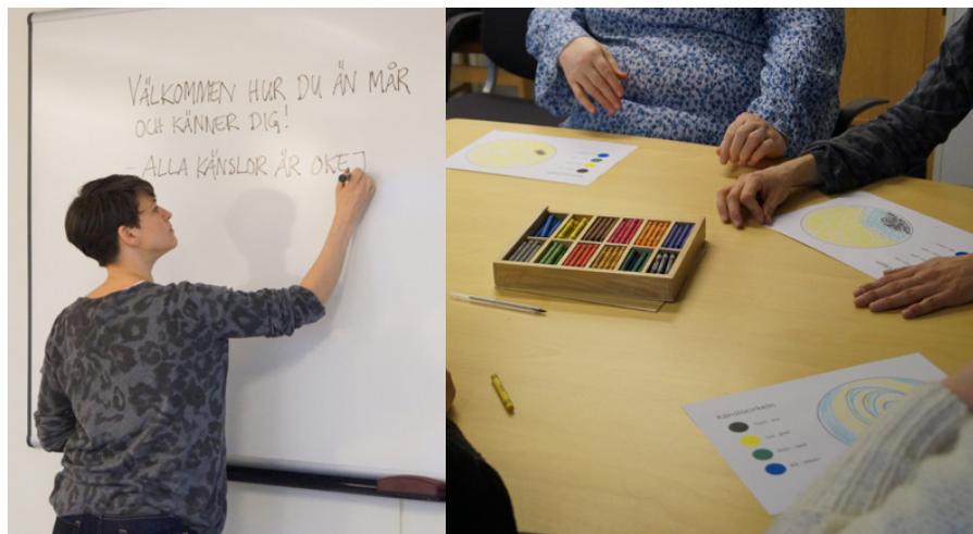
I V.I.P-programmet har varje tema ett budskap. Ett budskap är att "Alla känslor är okej".

I V.I.P-programmet träffas gruppen 12 tillfällen och går igenom olika teman med hjälp av praktiska övningar.