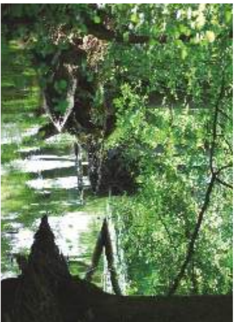
Kring Karl IX kanal bildar träden en lummig tunnel.

Vilsta var under en lång tid en storgård och herrsäte. Vilsta herrgård finns ännu kvar men ligger utanför reservatet. I det sydöstra hörnet kan du se rester av ett av de torp som hörde till markerna. Dalkarlstorpet.