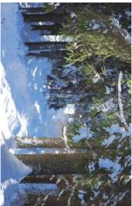
Vinterskogen lockar till promenader och pulkakörning.