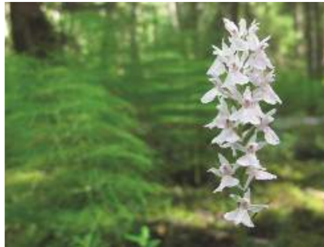
Jungfru Marie nycklar i sumpskogen.