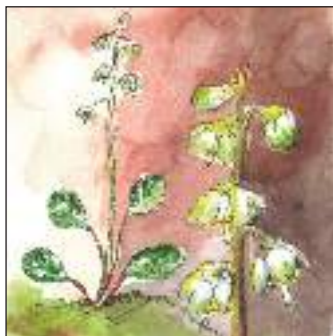
Grönpyrolan växer gärna i gamla barrskogar.

Reservaten ligger kant i kant och bildar tillsammans ett 160 ha stort barrskogsområde med många vackra platser att upptäcka, stigar att vandra och spännande naturupplevelser att njuta av. Här kan du grilla eller stilla njuta av solglittret i sjön. Har du tur kan du möta en älg eller höra hackspettarna trumma på en träd-stam.