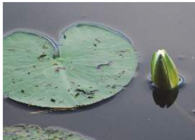
Näckrosen blommar ännu i Skiren.

Reservatet Skiren-Kvicken har fått sitt namn av de två sjöar som finns här. Trots att de ligger så nära varandra är de helt olika till sin karaktär. Skiren är en näringsrik sjö där många sorters vattendjur lever, medan Kvicken är näringsfattig med brunt vatten färgat av granarnas och tallarnas sura kompost som faller från skogen runtomkring. Skiren med sitt näringsrika vatten kommer på lång sikt bli ett kärr med gräs och halvgräs och därefter skog, medan Kvicken blir en mosse skapad av vitmossan som sakta växer ut i vattenspegeln. Tolamossen i det norra reservatet var också en sjö, men är nu en helt sluten mosse. Där har också torv brutits kommersiellt och spår efter järnvägen som fraktade ut torven finns ännu kvar.