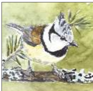
Tofsmesen är lätt att se där den letar mat bland grangrenarna.

Området har flera partier av rejält blöta skogar, sumpskogar. Här finns en lång rad djur och växter som är kräsna och kräver jämn fuktighet och lång tid för att utvecklas. Olika trädslag klarar blötan olika bra. Vissa sumpskogar har mycket björk, som inte blir så långlivad medan andra domineras av alen, den ypperliga översvämningsspecialisten som tål mycket vatten utan att ruttna. Alens knöliga rötter skapar en skyddad minimiljö där många ovanliga arter trivs.