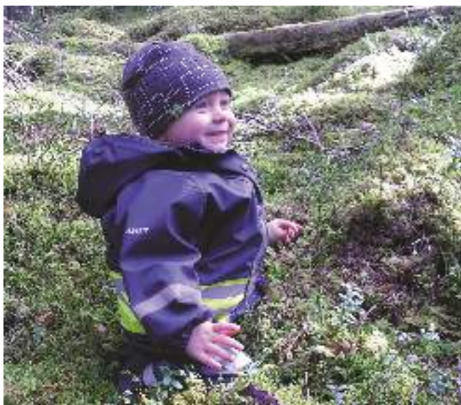
En glad besökare i trollskogen.

Området har lite olika karaktär. Tolamossen har mest tallskog medan Skiren-Kvicken istället har mest granskog.