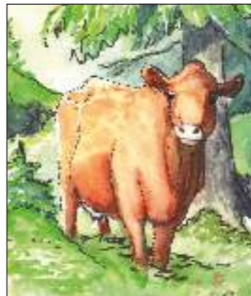
Förr lät bönderna djuren beta i skogen.

I hela området betade förr kor, får, getter och hästar. Skogen är gles och full av ljusa gläntor som bildats dels av djurens bete, dels av plockhuggning och vindfällan. Många av de gamla träden har vida grenar och det får de bara när de växt upp i gles skog med mycket ljus.