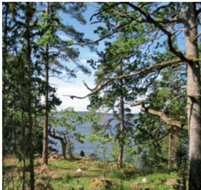
Utsikt över Näshultasjön.

Rester av äldre tiders byggnader och anläggningar finns att upptäcka på många håll i reservatet. Särskilt rikligt med lämningar