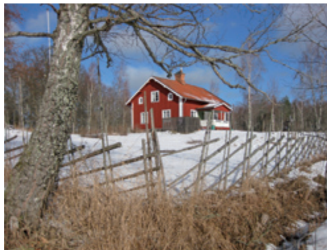
Vår vinter i Kvarntorp.

finns i området kring Kvarntorp. Längs vägen ner mot Kvarntorp, precis där vandringsleden svänger upp mot skogen finns den plats som var gårdens centrum innan man flyttade till nuvarande läge på 1890-talet. Här kan man hitta terrasseringsgrunder till boningshus, ladugård, och andra byggnader, fruktträd, bärbuskar och andra trädgårdsväxter. Längre in i skogen längs vandringsleden finns en kolbotten och resterna av en kolarkoja. Tvärs över vägen från Kvarntorps gamla tomt, nere vid bäcken har funnits en skvaltkvarn och i närheten av denna finns en källargrund.