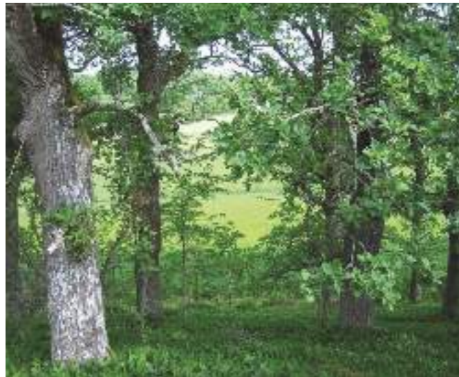
Ekarna står i en matta av liljekonvalj.

Ekbacken har använts av människor i långa tider. Här finns många lämningar och spår av tidigare besökare. Området har två fornlämningar, en stensättning och en annan som man inte vet riktigt vad det är. Stensättningen ligger mitt uppe på kullen. Den är 8 meter tvärs över och nästan en meter hög och består av stenar i storleken mellan 3 och 8 dm. Här har någon begravts på brons- eller järnåldern