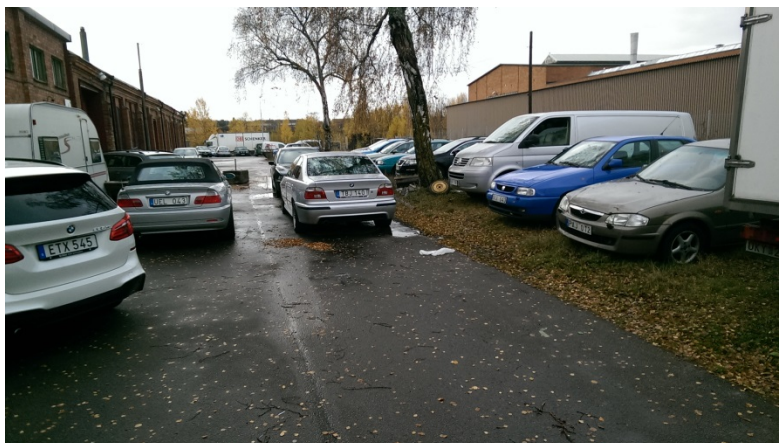
Bild 3: Ytor vid Ståhlbergsgatan som används för uppställning av fordon.

När Kungsgatan byggs om inom ett antal år finns även möjlighet att skapa kantstensparkeringsplatser längs delar av gatan. Uppskattningsvis skulle det kunna ge ett tillskott på ca 50-100 platser men det beror mycket på hur gatan ska utformas och hur stor andel av bilflödena som beräknas flytta till Gredbyvägen.