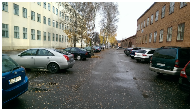
Bild 2: Ytor vid Ståhlbergsgatan som används som privat parkering.

Ytorna vid "parkeringarna" längs Ståhlbergsgatan vid kv. Valnöten är allmän platsmark men används för privat parkering och uppställning av fordon för en billackeringsfirma. De platserna bör regleras om och rustas för att kunna användas som allmän parkering. Sammanlagt kan det skapas 90-120 p-platser beroende på hur mycket grönytor som ska sparas. I nuläget står det dock parkerade bilar på en del av dessa platser och de förväntas ta upp en del plats även vid en omreglering. Reellt antal tillskapade platser blir därför sannolikt 60-80 platser.