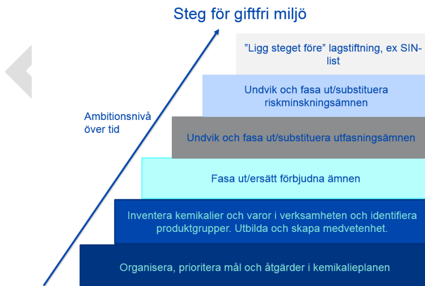
Bild 1. Trappa som visar vilka steg som behöver tas i kemikaliearbetet och ambitionsnivån över tiden 2019-2030.