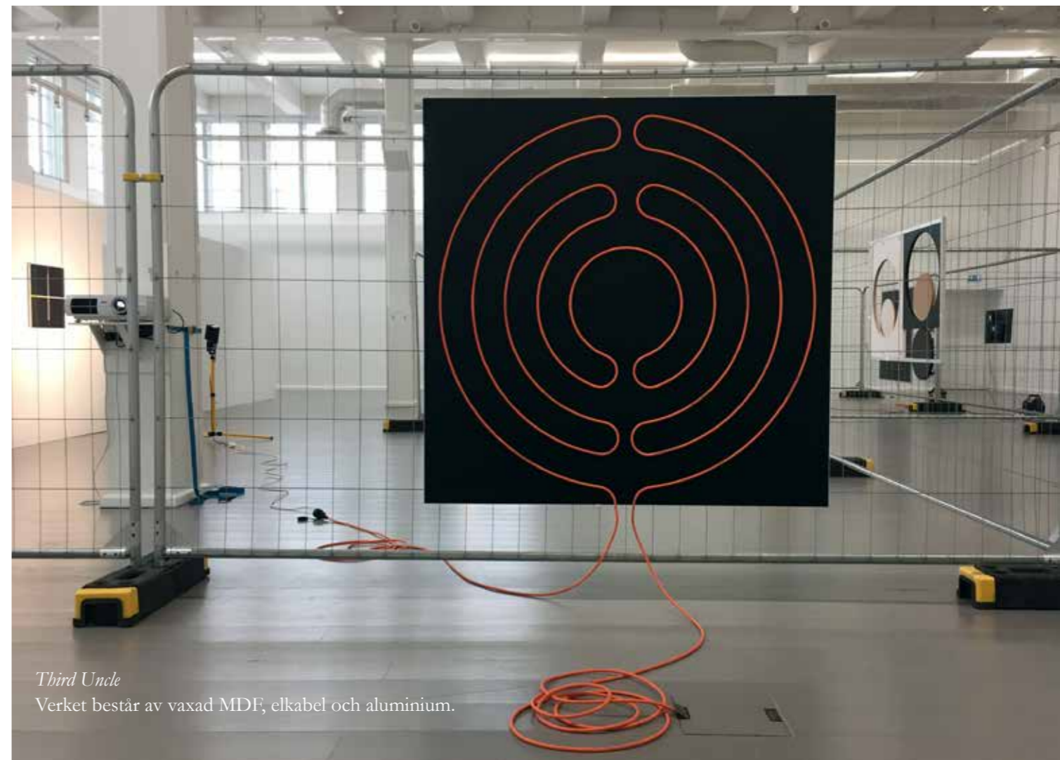
Third Uncle Verket består av vaxad MDF, elkabel och aluminium.

Byggstängslet går som en labyrint i rummet och stängslen styr hur vi rör oss i rummet. Vi kan överblicka utställningen igenom det rutiga gallret och vi ser baksidorna av verken, hur de är monterade och hur de är upphängda. De tekniska lösningarna som annars göms, som skarvsladdar och projektorer, blir en del av utställningen.