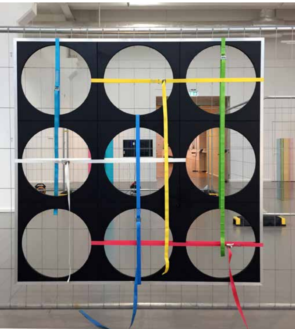
Not and Or 18 Ett collage av sågade och utsågade delar i MDF, skickligt monterade med spännband och skruv, i listramar av aluminium.