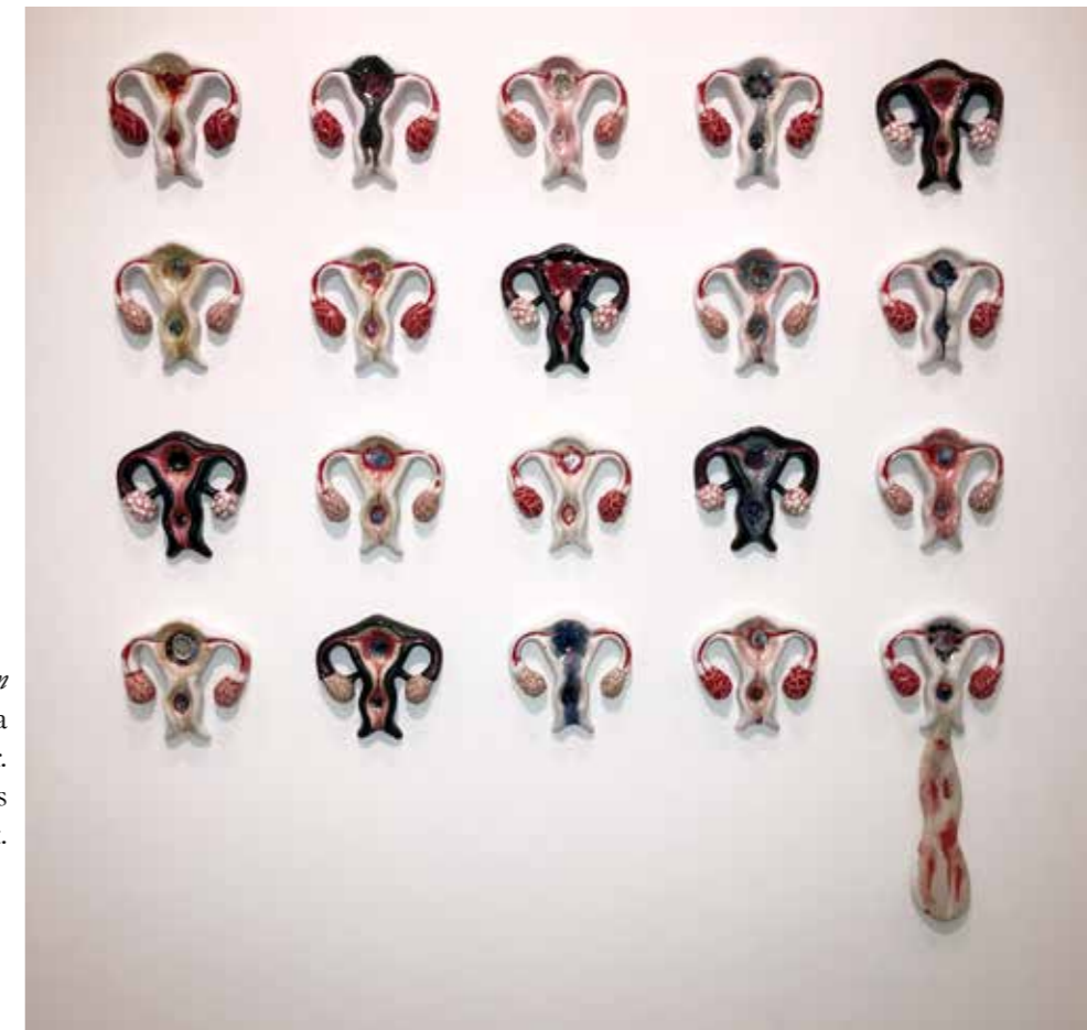
Menopause-kroppsrum Livmodern och den kvinnliga livscykeln i olika stadier. Livmodern, som ett rum där liv skapas, vars förmåga förloras i och med klimakteriet.

I en tid när tabun kring menstruationen håller på att lösas upp vill hon skapa något vackert till kvinnorna och kvinnans livscykel. Verken i utställningen tar upp menstruationen, menopausen och att åldras. En hyllning till en åldrande kvinnlig kroppsdel.