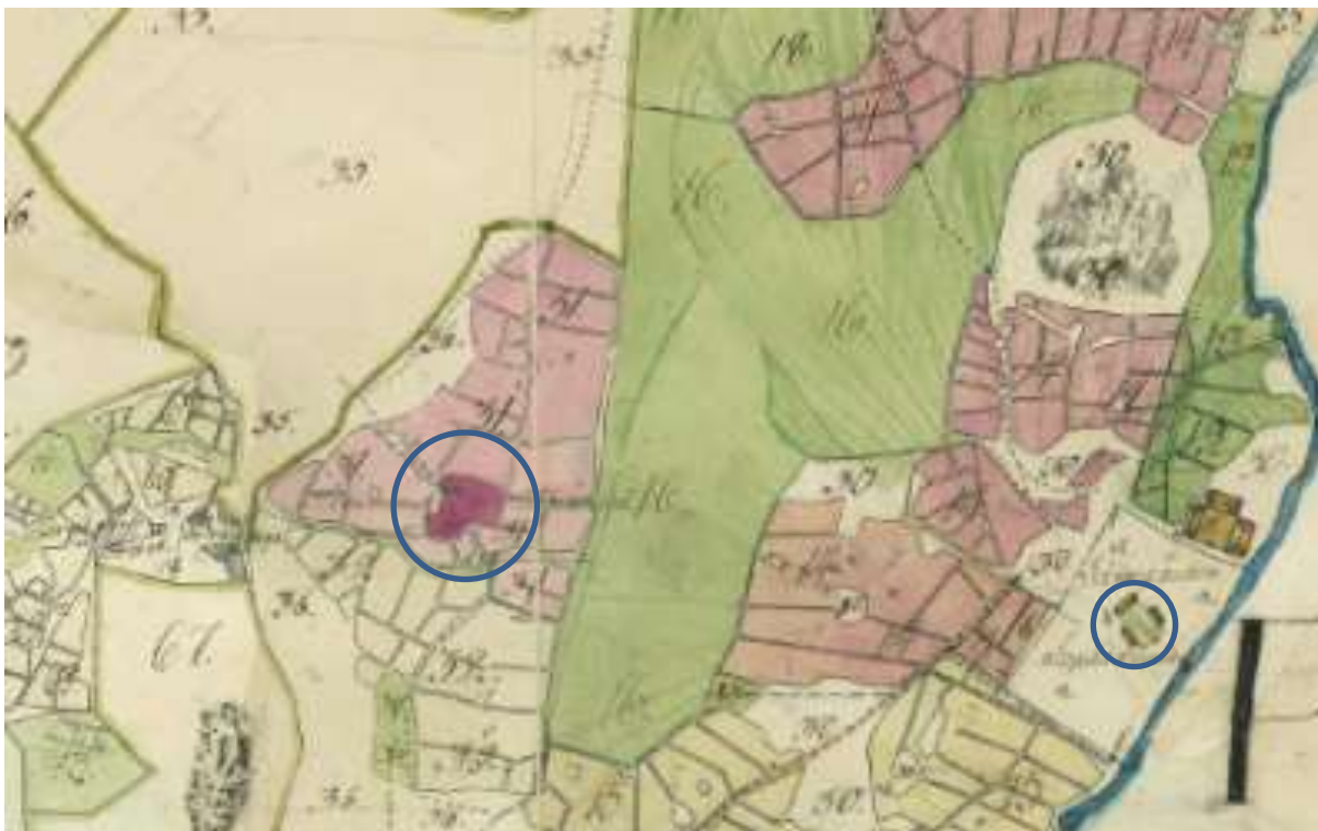
Källtorp (röd yta) och Sofielund (till höger vid vattnet) 1795, Lantmäteriets historiska kartor. Lantmäterimyndighetens arkiv 04-FOA-24