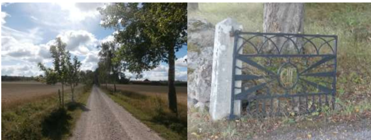
En "dagpendlares" väg till jobbet