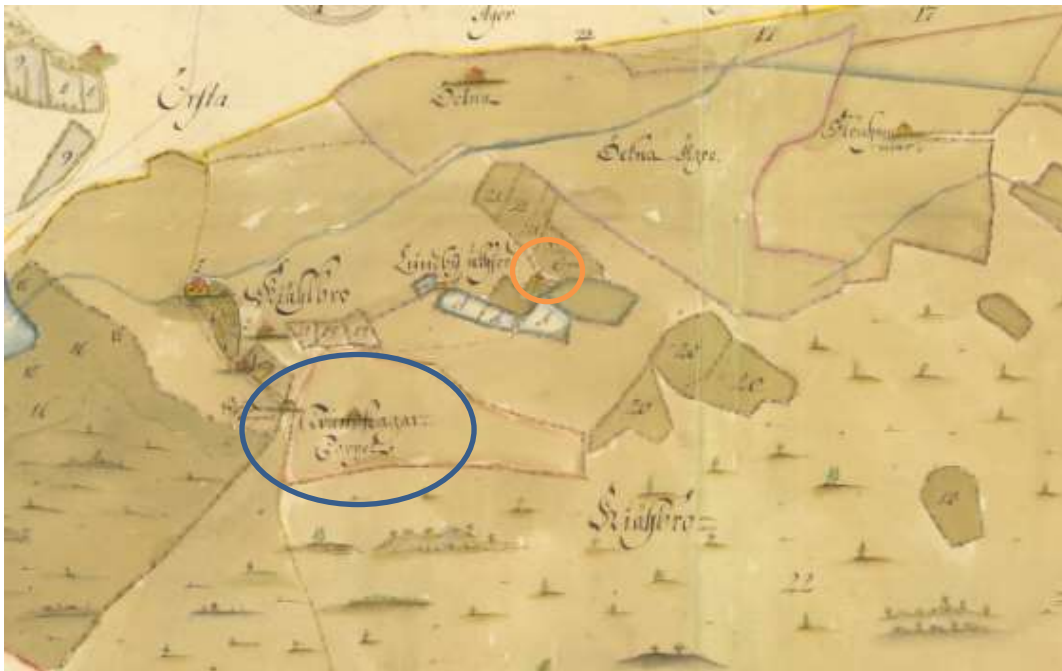
Via Lantmäteriet historiska kartor hittar jag Kälbro 1727 Trumslagartorpet. Lantmäteristyrelsens arkiv Stenkvista socken Kälbro 1-3.

I Stenkvista församling, Kälbro by finns det jag söker. En karta från 1727 är särskilt intressant. Den stora blå ringen nedan ringar in ett trumslagartorp och mindre orangea Kälbro soldattorp, båda intressanta för mig.