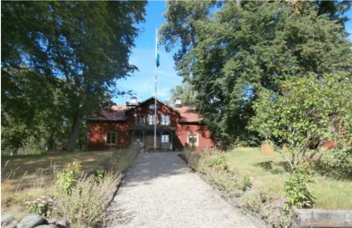
Stora Häradsäng 2017, 190 år senare.