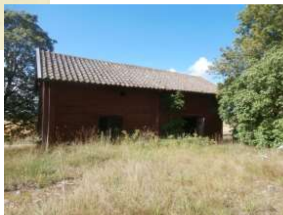
Till vänster: Banninge, C-gården, sent 1800-tal? Ovan: En av de äldre ekonomibyggnaderna.