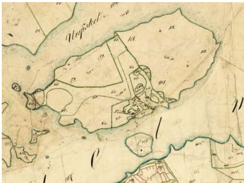
Nordön 1829 Lantmäteriets historiska kartor Nordön. Lantmäterimyndighetens arkiv 04-HUR-53.

Nästa karta från 1829, visar tydligt att här finns ett torp.