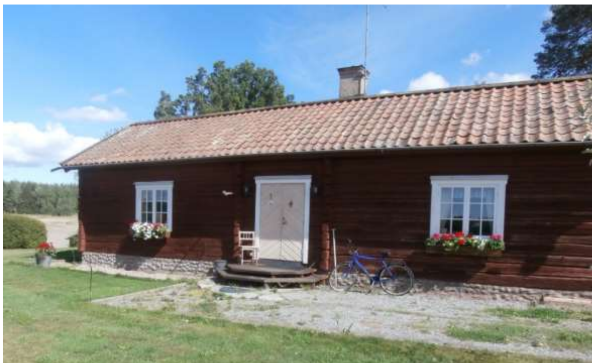
Kroberga, hus från den tiden, kanske bodde de här men säkert i ett liknande hus, dock utan blå cykel.

Hur de bor vet jag inte men frun i huset visar på det hon kallar en "drängstuga", som skall vara från den tiden.