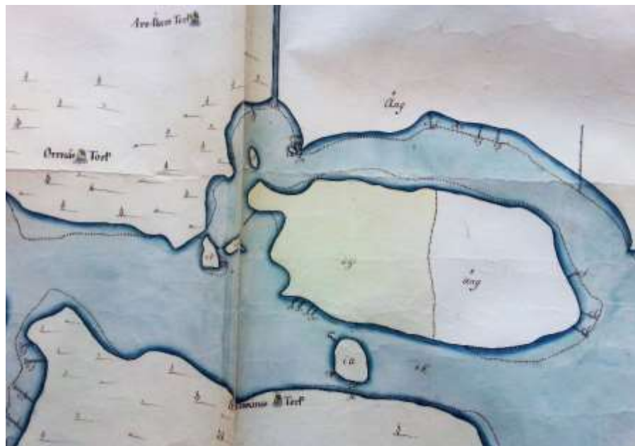
Nordön/Oxön på karta över Hyndevads ström 1755.

Däremot fiskades det runt ön; de små strecken ut i vattnet märkta cn är markeringar för "mörtvasar" 5 , ett system av mjärdar för att fånga fisk. Halva ön är markerad som äng, vilket bekräftar att den redan då användes för bete.