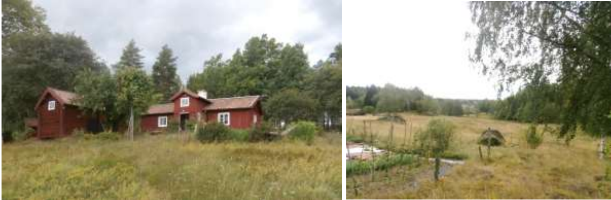
Simonstorp, Östra Grysta: torp och utsikt. Påbyggnaden på mitten är av senare datum.

Vi cyklade runt Valdemaren genom Grysta och till Sköttlund. I Östra Grysta hittar vi ett torp av samma ålder som Eklunda, det kan kanske ge en bild av hur det såg ut en gång.