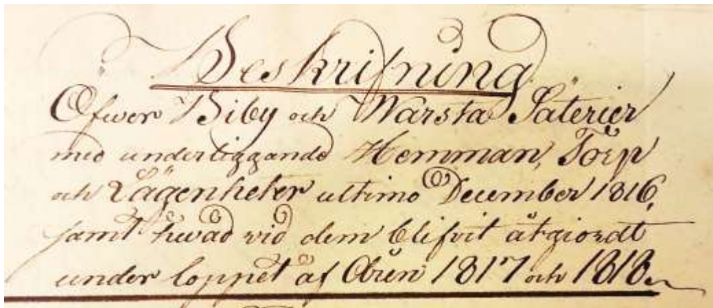
Beskrivning ur Biby gårds arkiv, Arkiv Sörmland.

Mitt antagande att de var först på Nordön och att de även tjänade hos Celsing i Stockholm får ett bra stöd av Helena på Arkiv Sörmland: I Bibys gårdsarkiv finns nämligen följande: