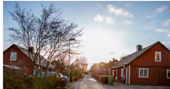
DÅTID-NUTID | Bruksbyn som det såg ut på 1800-talet (övre bilden) och så som det ser ut idag.