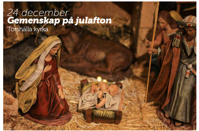
24 december Gemenskap på julafton Torshälla kyrka

Med reservation för ändringar. Uppdaterad information finns på evenemang.eskilstuna.se . Arrangör? Registrera gärna ert evenemang eller aktivitet i evenemangsguiden. Kostnadsfritt!