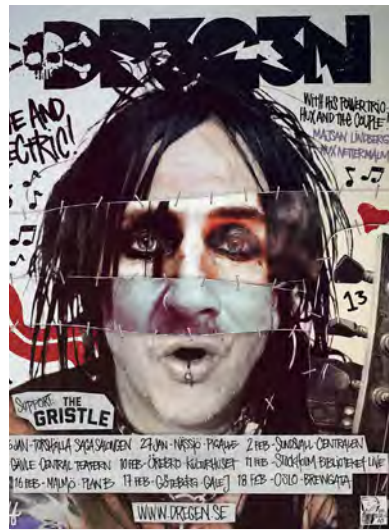
26 januari Dregen Kulturhuset Saga.