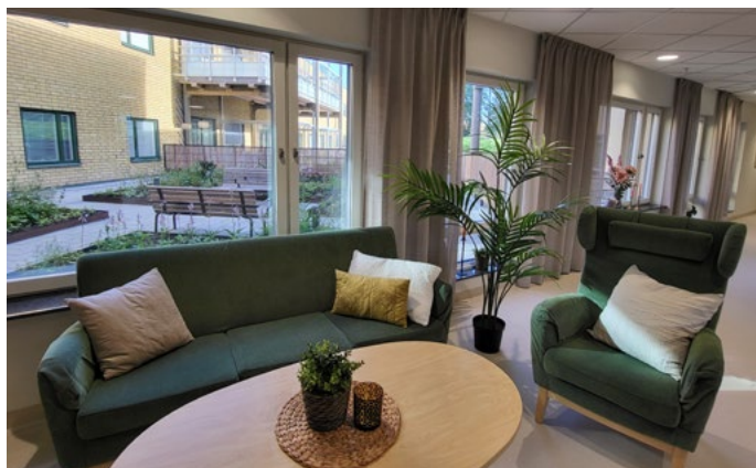
De nya lokalerna har ombonade gemensamma ytor för de boende.