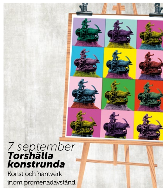
7 september Torshälla konstrunda Konst och hantverk inom promenadavstånd.

Den kulturintresserade hittar här massor av aktiviteter under hösten, att ta del av antingen som "konsument" eller genom att själv vara aktiv och skapa. Med Torshälla kulturfestival och Torshälla konstrunda 7 oktober erbjuder kommunens verksamheter tillsammans med Torshällas föreningar och andra aktörer på olika aktiviteter runt om i staden. Fler evenemang och mer information på evenemang.eskilstuna.se