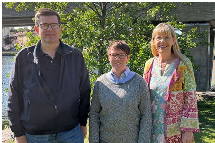
Tveka inte att höra av dig till kommunens budget- och skuldrådgivare.

Om du upplever ekonomisk oro, till exempel om din ekonomiska situation förändrats, kan du få stöd av kommunens budget- och skuldrådgivare. De kan hjälpa dig att göra en budget för ditt hushåll, se över din skuld-situation, upprätta avbetalningsplaner och ansöka om skuldsanering.