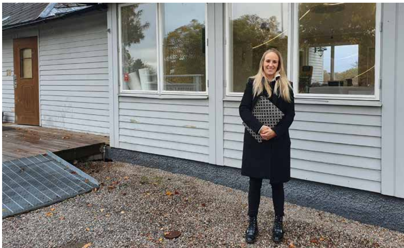
Text och foto: Karin Wejderot