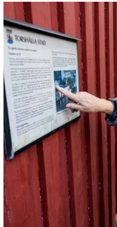
Gårdshuset ner mot ån på Storgatan.