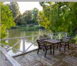
Garvargården. då och nu.