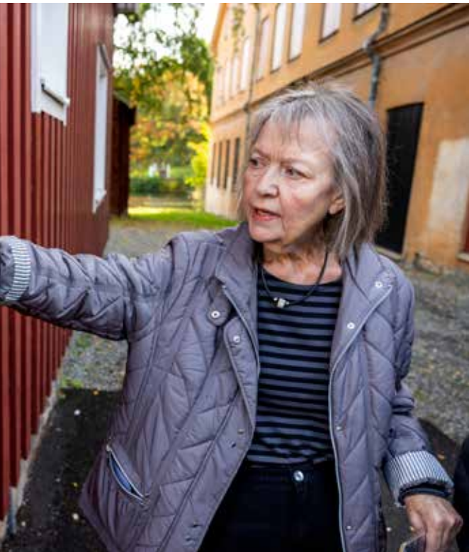
Själva garveriet som låg längs med Torshällaån revs i mitten på 1900-talet.